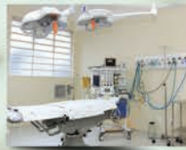
UNIDADE JARDIM DO MAR

Com consultórios modernos e equipados e um ambiente humanizado, os médicos dispõem da mais alta tecnologia para atender seus pacientes.